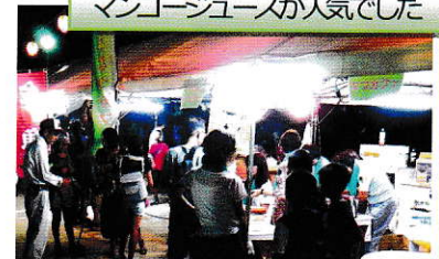
マンゴージュースが人気でした