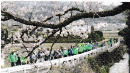
春のウォーキングの様子

あかしあ台小学校区の体育振興や地域の皆さま方の親睦を図る行事の運営と自治会行事などの応援組織として、元自治会役員経験者が中心となり約15年前に設立されました。現在では50名を越えるメンバーが、春のウォーキング、秋の名所探索バスツアーやソフトボール大会等主催、自治会の夏祭りへの出店やとんど焼き、ウディタウン運動会の応援、その他の行事に世代を越えて和気あいあいとボランティア精神を持って楽しく活動しています。