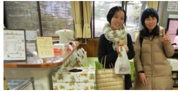
ルフラン三田店 (4丁目) より 景品のご提供を頂きました。