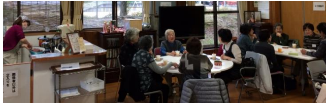
11/8 スマートカフェ (大人)