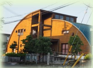
あかしあ台コミュニティハウス (あかしあ台1丁目)

あかしあ台のコミュニティは、自治会員の班委員や役員のボランティア活動と会費で支えられています。自治会未入会のみなさまはぜひ加入をお願いします。