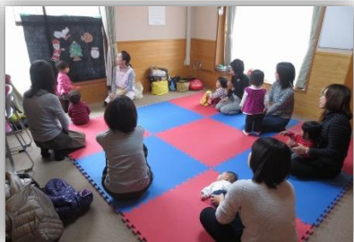
12/14 ファミカフェ (親子あそび)