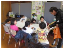
1/14 スマートカフェ (子ども)