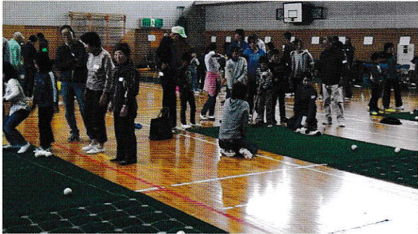
囲碁ボールの様子