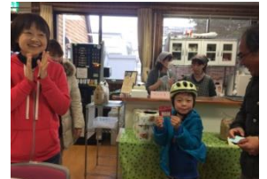
カフェ利用券、当たったよ!