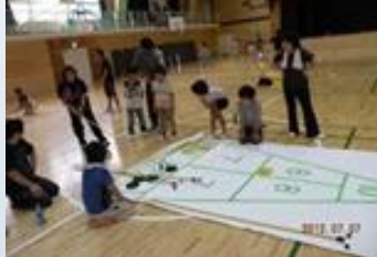
シャッフルボード (イメージ)