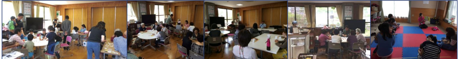
スマートカフェ 5/21 子ども達も スマートカフェ 5/31 なんちゃってライブ 6/1 スマートカフェ 6/7 ファミカフェ 6/8

【お問合せ】まち協事務所(毎週 火/水/土 9:00～13:00) 8月の毎週水・土と8/16はお休み (あかしあ台コミュニティハウス1階 多目的室内) イベント持ち込み企画 募集中