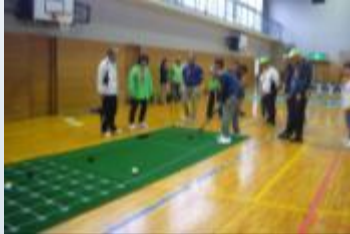
囲碁ボール (昨年あかしあサロンにて)