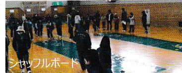
シャッフルボード

まち協構成団体から成る実行委員会を立ち上げ、開催しました。 老若男女約80名が10チームに分かれ、「囲碁ボール」と「シャッフル ボード」で対戦しました。三田市スポーツ推進員(3名)からの説明を 聞き、暫く練習した後、ゲーム開始。最初のうちは、初対面の方も居り、 静かでしたが、ゲームが進むにつれ、歓声が響き渡るようになりました。「たのむよ~!!」と孫から激励されな がらもプレッシャーに負け、ポイントならずのおばあちゃん、、、 そんな面白く楽しい場面があちこちで見られました。