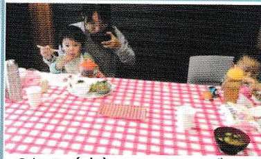
6/14(水) ランチ・デー この日は、小さいお子さんとお母さんが一緒でした。