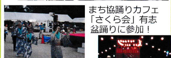
まち協踊りカフェ「さくら会」有志盆踊りに参加!