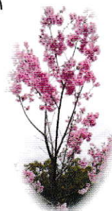
今年4月初旬のあかしあ台公園

4月初旬、あかしあ台公園にピンクの可愛い花びらの陽光桜が開花しました。 この3年間、まち協事業の名所づくりとして、桜の植樹に取り組んできました。 現在、10本の陽光桜が植えられています。