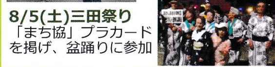
8/5(土)三田祭り「まち協」プラカードを掲げ、盆踊りに参加