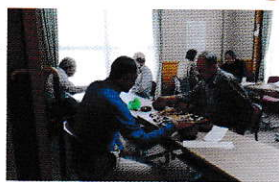
真剣なまなざしで対局中