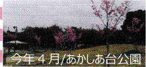
今年4月/あかしあ台公園