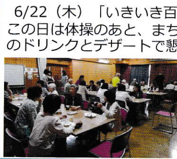
6/22(木) 「いきいき百歳体操」 この日は体操のあと、まち協カフェのドリンクとデザートで懇親会。