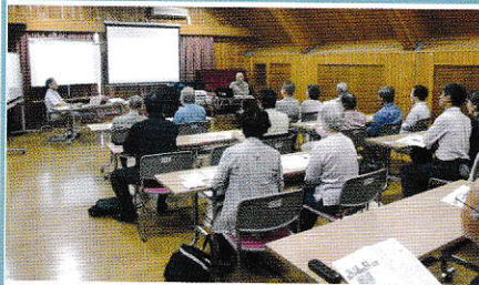
6/17(土) 住民による講演会 "中東で何が起きているのか"