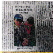
神戸新聞にも掲載

学生からのメッセージ、参加した小学生の絵日記や写真集は、まち協事務所でご覧いただけます。まち協役員やカフェスタッフも見守りとして協力しました。