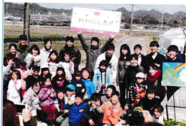
農園で野菜の収穫体験