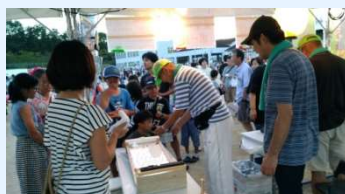
夜店の協力支援は「平谷川のホタルを守る会」