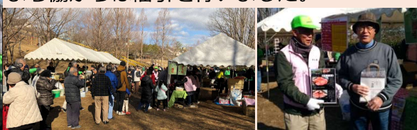
まち協福引 1等三田牛お肉、大当たり

晴天に恵まれ、恒例のあかしあ台とんど焼きが1/13(日)はじかみ池公園でありました。まち協からは福引を行いました。