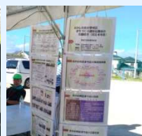
まち協紹介パネルの掲示

ウッディ・カルチャー地区 申込 10/10 まで ふれあい健康ウォーキング大会と障がい者施設・作業所の方々と交流会 11/11(日) 警報・雨天中止