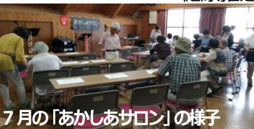
7月の「あかしあサロン」の様子

あかしあサロン（高齢者向け）、子育てサロン、枝豆狩りバスツアー、友愛訪問（高齢者宅など戸別訪問）、健康ウォーキング、健康講座、ラジオ体操 等