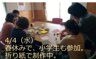
4/4(水) 春休みで、小学生も参加。折り紙で制作中。