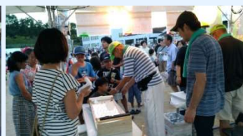
夜店の協力支援は「平谷川のホタルを守る会」