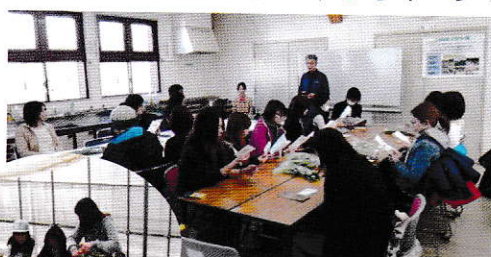
野菜についての講演会。 この後、新鮮な野菜の販売もあり完売。