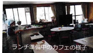
ランチ準備中のカフェの様子