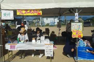
夏祭り出店の様子

小学校とPTAは開放参観、アートパーティー、PTA役員によるあかしあ台夏祭りへの出店、広報誌『あ☆ねっと』の自治会コミュニティハウスへの配布等を行い地域の方々との交流を持つ活動を行っています。