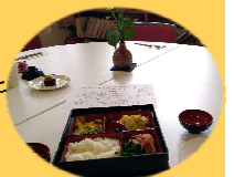
1月のお弁当ランチ (飲物付)

ブログ http://ameblo.jp/akasiamachiky/ フェイスブック https://www.facebook.com/akasiacafe