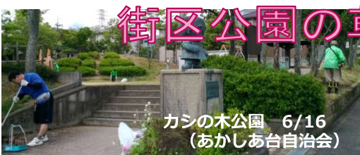
カシの木公園 6/16 (あかしあ台自治会)