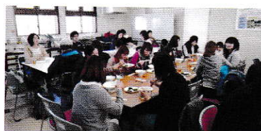
学生や地域スタッフが協力し、子ども達が収穫した野菜でポトフを調理しました。子ども達も保護者の方達も、皆と一緒に美味しくいただきました。