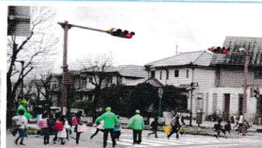
おはよう！いってらっしゃい！ 街のボランティアの皆さんに見守られて登校する小学生たち。