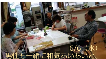
6/6(水) 男性も一緒に和気あいあいと。