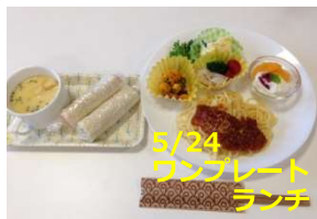
5/24 ランプレートランチ