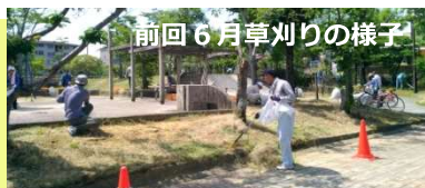
前月6月草刈りの様子

10月に今年度2回目草刈りを実施します。地域団体のボランティア作業です。皆様のご理解をお願いします。( )内は担当団体です。