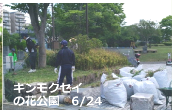
キンモクセイの花公園 6/24