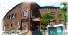
あかしあ台自治会のコミュニティハウス