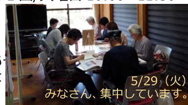
5/29(火) みなさん、集中しています。

使いたい絵柄や色鉛筆を持ってきて、男性も女性も真剣なまなざしでぬり絵を楽しんでいます。