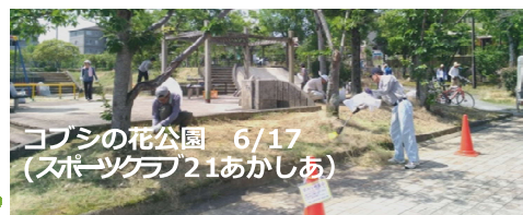
コブシの花公園 6/17 (スポーツクラブ21あかしあ)

三田市公園みどり課「作業説明会(1/17)」を受け、6月に1回目の草刈りを実施。「あかしあ台自治会」「スポーツクラブ21あかしあ」「あかしあ台体育振興会」「あかしあクラブ」の地域団体が地域の5公園を分担し、作業をしています。