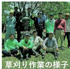
草刈り作業の様子