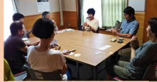
スマート・カフェ

トランプや簡単な頭脳ゲームで楽しんでいます。撮影中も時々、にぎやかに盛り上がっていました。