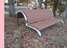
背伸ばしベンチ 2台