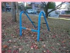
アームトレーナー 2台