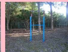
スプリングバー 2台