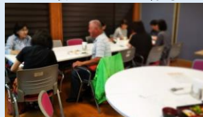
まち協ランチの様子

飲み物・デザート付き 500円、20食限定。 無くなり次第終了となります。予約もできます。7月・8月はあいにくお休みしますが、9月に再開しますので、皆さまのご利用お待ちしております。 おひとり様でも気軽にランチをお楽しみいただければ。