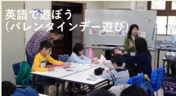
英語で遊ぼう (パレタインデー遊び)

放課後子ども教室 「英語で遊ぼう」と「頭を使って遊ぼう」の2本立てです。平成30年度は10回開催しました。まち協ではこの活動を支援しています。活動にご興味ある方は、お気軽にお問合せ下さい。