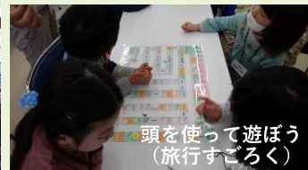
頭を使って遊ぼう (旅行すごろく)