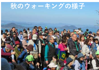
秋のウォーキングの様子