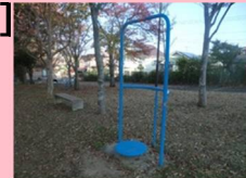
ツイストボード 1台