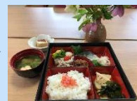
3月のお弁当ランチ(飲物付)

ブログ http://ameblo.jp/akasiamachiky/ フェイスブック https://www.facebook.com/akasiacafe