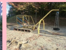
クレーン車遊具 1台