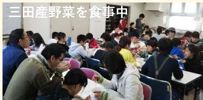
三田産野菜を食事中

運営：三田を知ってもらい隊 (三田市学生まちづくりワークショップ活動) 協力：まち協