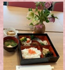
別の日のお弁当ランチ